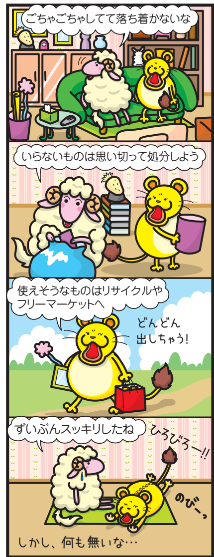
Sheepers!! © KNACKツイン

このまんがのキャラクターがホームページに! 下記のアドレスに遊びに来てね! http://www006.upp.so-net.ne.jp/knacktwin/