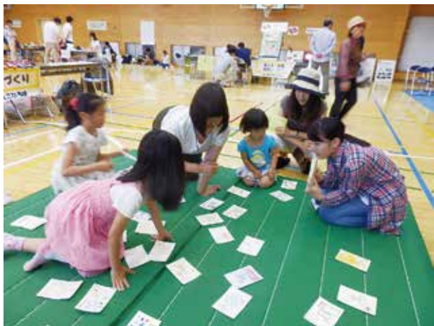
↑エコカルタを楽しむ子ども達