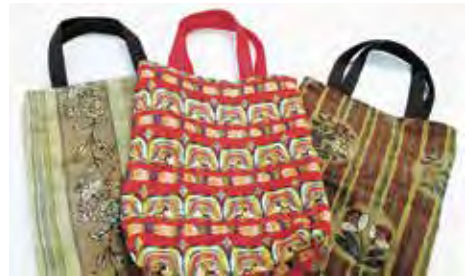
↑帯で作ったバッグ