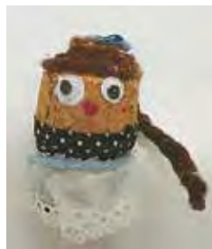
↑コルク栓と毛糸や布でもっくん人形