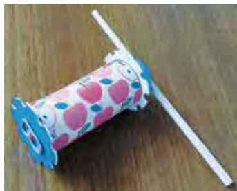
↑レシート芯やペットボトルのふたを使ったカタカタ車